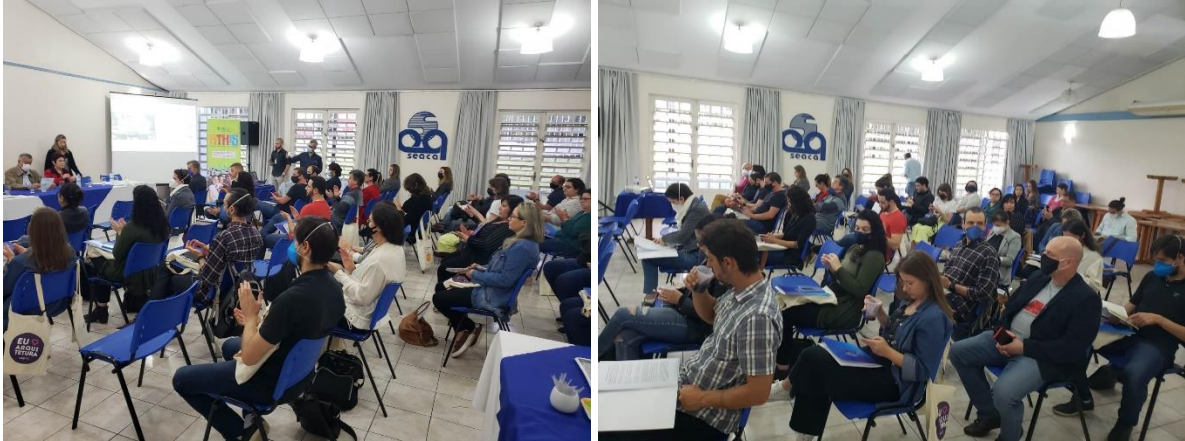
Foto 7 – Evento Presencial com Arquitetos Contatados - Assinatura dos Contratos