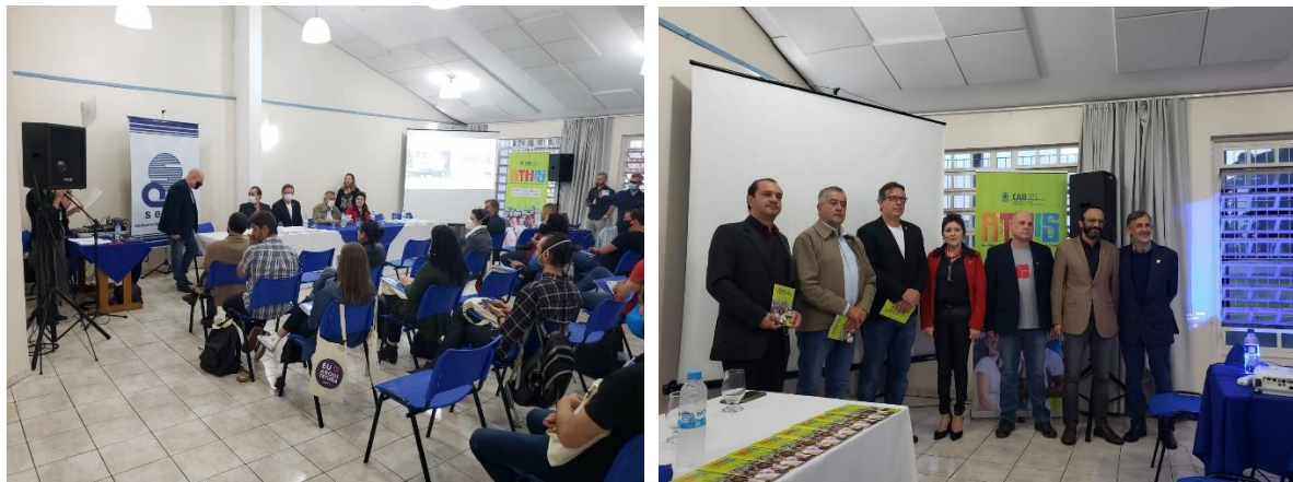
Foto 8 – Evento Presencial – Prefeito Municipal / Presidente CAU/ Parceiros