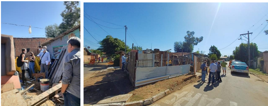
Foto 5 - Projeto Piloto - 10 primeiras famílias

19/abr: Piloto de atendimento as 10 primeiras famílias